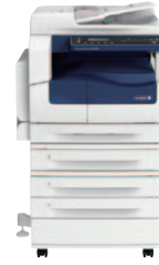
โมเดล 1 มา โมเดล 2 มา

* ขอแนะนำให้ใช้ผลิตภัณฑ์ในเครือข่ายของเราเพื่อประสิทธิภาพสูงสุดของการทำงานที่เหมาะสมและการประหยัด