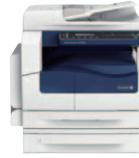
โมเดล 1 มา